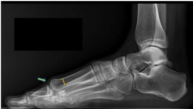
圖一：第一跖骨提升症，在側面 X 光圖第一跖骨高度明顯高於第二跖骨（如黃線所示），第一跖趾關節呈半脫位狀況，部分第一跖骨頭部未被近端趾骨所覆蓋（如綠色箭頭）。

第一跖骨提升症(Metatarsus primus elevatus)是一種足部疾病，它是指第一跖骨相對於第二跖骨的位置向上方提高(圖一)。最近利用站立式 CT 證實了在第一跖趾關節炎患者中，第一跖骨的高度明顯升高 (1)。另一篇論文也指出第一跖骨提升症的患者日後有比較高的機會發生第一跖趾關節炎(圖二)，第一跖骨提高程度多於 5mm 的患者發生關節炎的風險大幅提高 (2)。