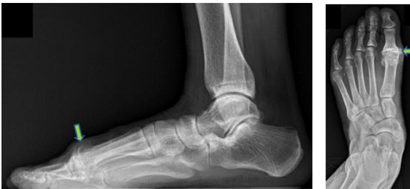
圖二：第一跖趾關節炎，左：側面圖，右：正面圖可見明顯關節破壞現象（如箭頭所指）。